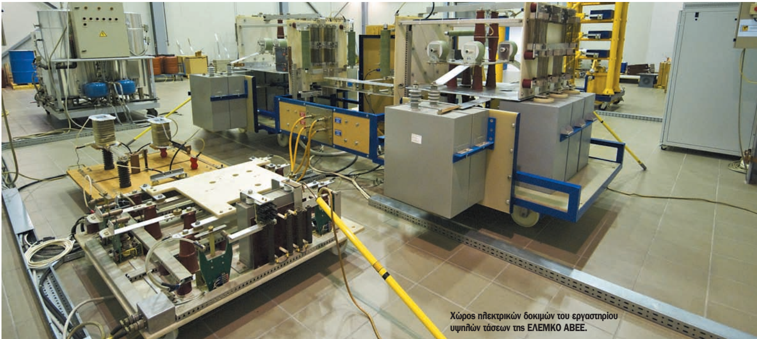
Χώρος ηλεκτρικών δοκιμών του εργαστηρίου υψηλών τάσεων της ΕΛΕΜΚΟ ΑΒΕΕ.

Πόσο έχει επηρεάσει την εταιρεία σας η δραματική συρρίκνωση της εγχώριας κατασκευαστικής και οικοδομικής δραστηριότητας;