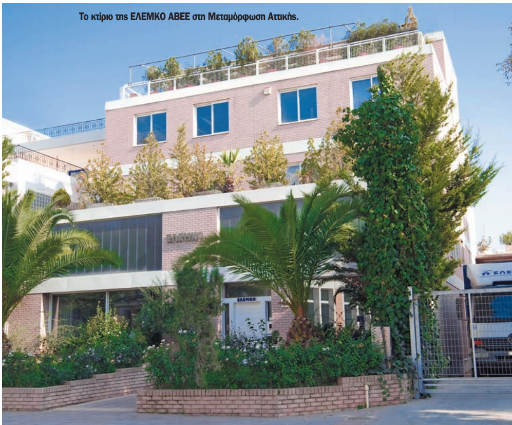
Το κτίριο της ΕΛΕΜΚΟ ΑΒΕΕ στη Μεταμόρφωση Αττικής.